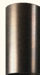
BRONZO BRUNITO SATINATO