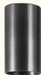
CANNA DI FUCILE